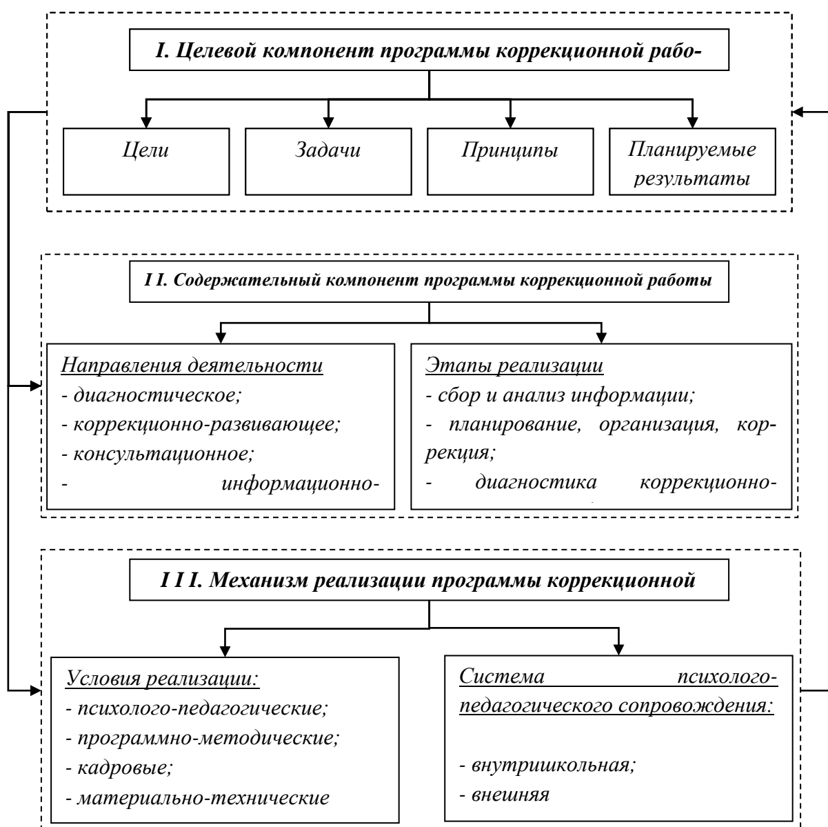
Рис.1 Взаимосвязь обязательных структурных элементов программы коррекционной работы